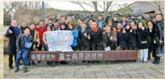
※セミナーに参加した 県女性役員の人々を撮影！

このたび、県の研修委員長として初めて富士研に参加し、山口県からの参加者が28名も初のことで、研修の3日間ずっと心強く、誇らしかったです。研修では沢山の事を吸収しましたが、中でも「本気」という言葉の本当の意味を教えて頂いた気がします。本気・努力・挑戦など、頑張らないとって身構えてしまいがちですが、それらを「〇〇=楽しい」に変えられたら、どんな事でもやり遂げることができる！教えて頂いた全てを、素直に実践していきます！