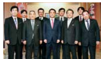
山口県知事 村岡 嗣政 ■プロフィール 山口県宇部市出身 1972年12月生まれ。 趣味はジョギング、読書。 好きな言葉「志を立てて、以って万事の源と為す。」